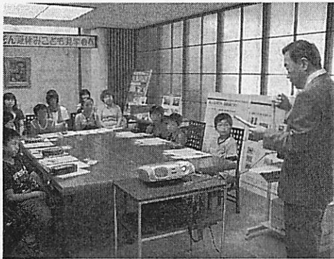
尾家所長の解説に聞き入る子どもたち

子どもたちに日銀や銀行、証券会社に親しみを持ってもらい、お金の大切さを感じてもらおうと毎年開いている。二日間