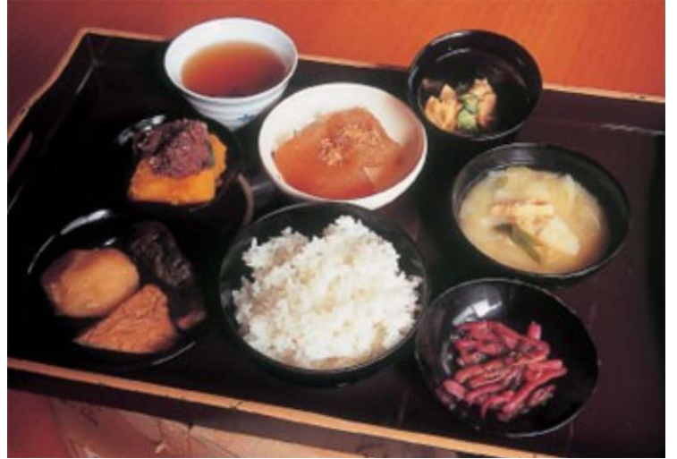
ご飯、厚揚げとじゃがいも、ナスの煮物、冬至南瓜、お茶、冬瓜の煮物、麩ときゅうりのカラシ和え、味噌汁、すこ(里芋(ハツ頭芋))の茎の酢割け