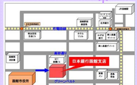
通用口(正面左側)からお入りください