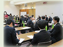
グループ協議の様様