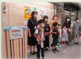
日本銀行松江支店ロビー見学

参加者からは、「普段見ることのできない日銀のロビーや展示物が見れて良かった」、「お札には様々な工夫がされていることが分かった」、「ゲームを楽しみながらお金の使い方を学んだ」などの感想が寄せられました。