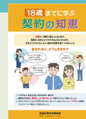
「金融広報中央委員会」発刊の冊子例