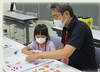
カレー作りゲーム