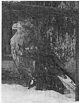
あざらし館のオジロフシ。事故で保護された鳥で片翼を失っており飛べません

捉えると、 全従業者数 に占める獣 医師数(う ち獣医事に 従事する 者)の割合 は、県内G DPにおけ る第1次産 業のウェイトが 高いほど 高くなる 傾向がある ようです。 北海道の獣 医師の比率 は高く、全 国二位で