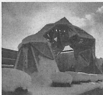
数々の名演奏が繰り広げられてきた旭川市音楽堂の入り口。大雪クリスタルホール

映画「The Sound of Music」(一九六五)は、オーストリアの退役軍人(元大佐)の家庭に家庭教師で入った主人公の修道女見習いが、厳格に育てられた七人の子どもに歌の楽しさを教える話で、実話に基づいています。元大佐は、地元では名士ですが、オーストリアに併合される途端、全国の景気が腰折れし、旭川市経済も夢はかなく水を差され、旭川市に陥らないよう、旭川市経済の自律的な回復を祈念しています。