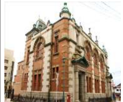
きゅうからつぎんこう 旧唐津銀行