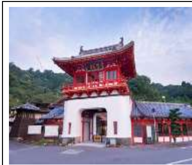
たけおんせん 武雄温泉 ろうもん 楼門

* 日本銀行佐賀事務所のホームページ (リンクー日本銀行佐賀事務所ー佐賀事務所についてーにちぎんと佐賀県のつながり)にも答えがあるよ！