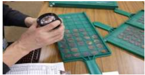
傷んだ硬貨の鑑定(かんてい)をしている様子