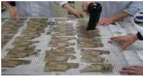
ぬれたお札を乾かしている様子