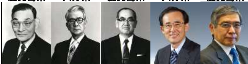
第18代 イチマダ ヒサト 一萬田尚登 大分県 第23代 モリナガ テイチロウ 森永貞一郎 宮崎県 第26代 ミヅノ ヤスシ 三重野康 大分県 第30代 シラカワ マサアキ 白川方明 福岡県 第31代 クロダ ハルヒコ 黒田東彦 福岡県