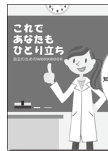
これであなたもひとり立ち ～自立のためのWORKBOOK～