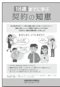
18歳までに学ぶ 契約の知恵