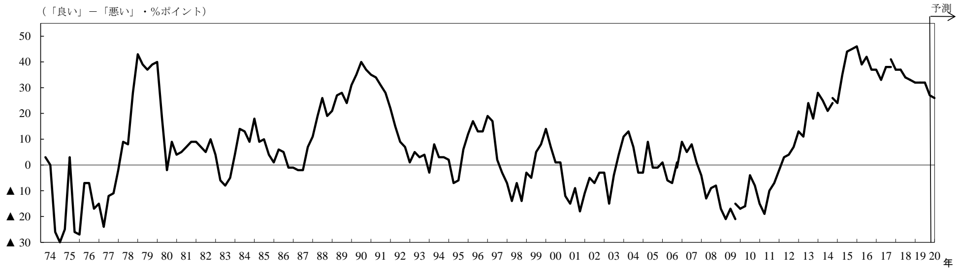
製造業、非製造業別業況判断D. I.