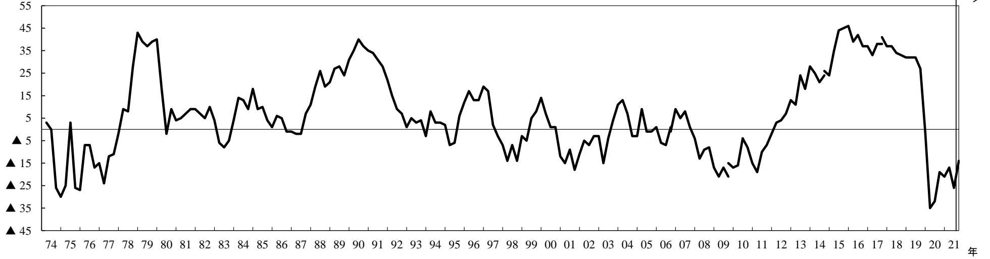
製造業、非製造業別業況判断D. I.