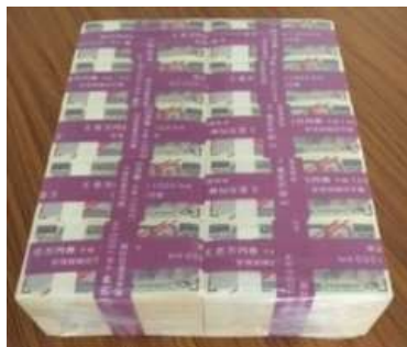
(一億円模擬パック)